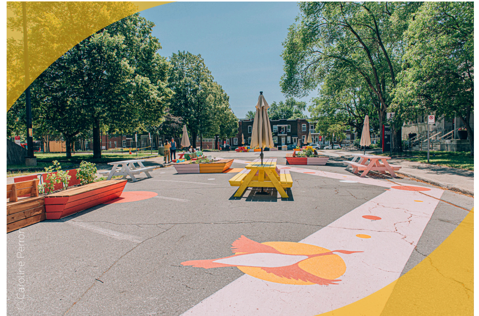
Nouvelle placette publique devant la mairie de Verdun

La réduction des GES et de notre empreinte écologique pour assurer notre résilience face aux changements climatiques