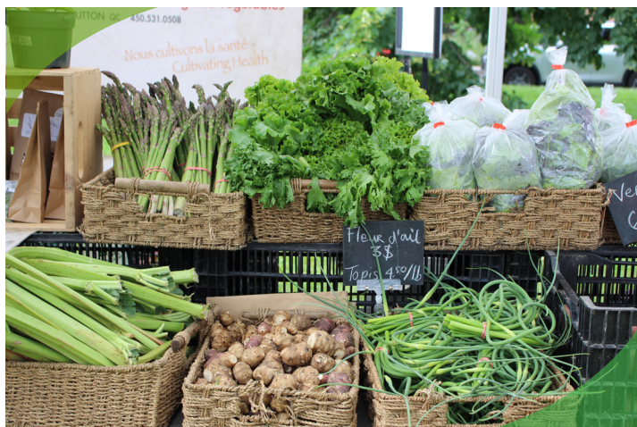
Marché extérieur devant la bibliothèque Jacqueline-De Repentigny