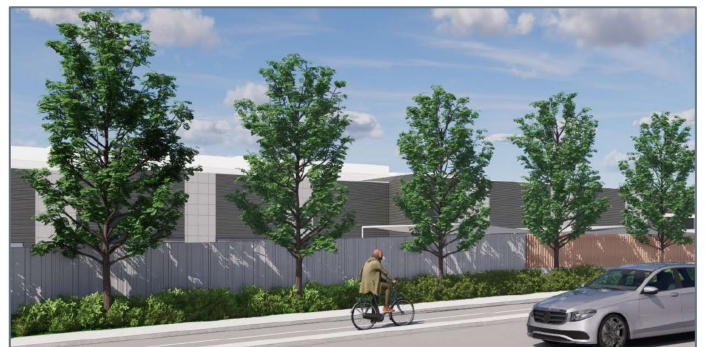
Vue de la cour de services depuis l'avenue Christophe-Colomb