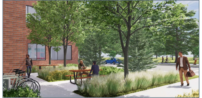
Vue de l'aire de repos depuis l'intersection Saint-Grégoire/de Mentana