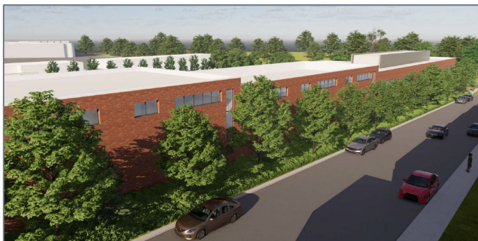
Vue du bâtiment principal à la hauteur des terrasses au toit des résidences de la rue de Mentana