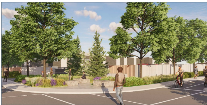
Vue de la placette depuis l'intersection Saint-Grégoire/Christophe-Colomb