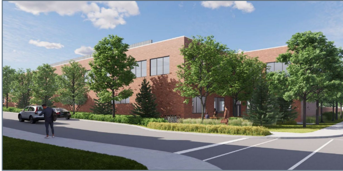
Vue du bâtiment et de l'aire de repos depuis l'intersection Saint-Grégoire/de Mentana

La cour actuelle accueille la section aqueduc-égouts de la direction des travaux publics de l'arrondissement. Le site, agrandi par l'achat du terrain au nord du clos existant, permettra de recevoir la section parcs-horticulture.