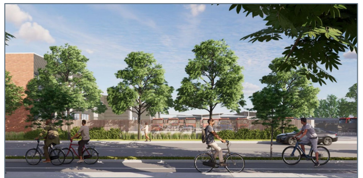
Vue de la cour de services depuis la rue Saint-Grégoire près du parc Sir-Wilfrid-Laurier