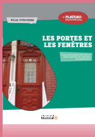
Les portes et les fenêtres