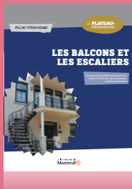
Les balcons et les escaliers