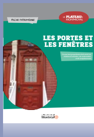
Les portes et les fenêtres