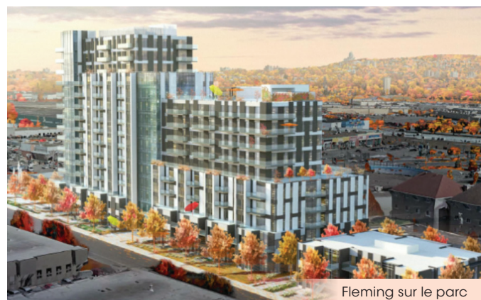
Fleming sur le parc

LaSalle's power of attraction and sustained efforts in the area of economic development are proving to be successful and the years to come will undoubtedly be just as favourable for investors.