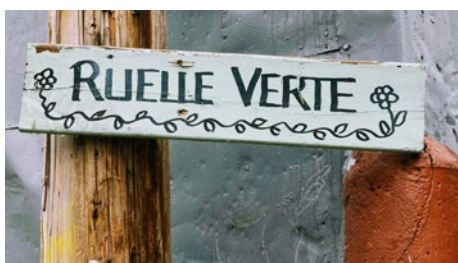
Ruelle Gilford, Mont-Royal, Chabot, Cartier

L'excavation et l'aménagement de la ruelle seront exécutés par une entreprise spécialisée engagée par l'arrondissement.