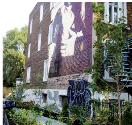
Ruelle Masson, Laurier, Érables, De Lorimier