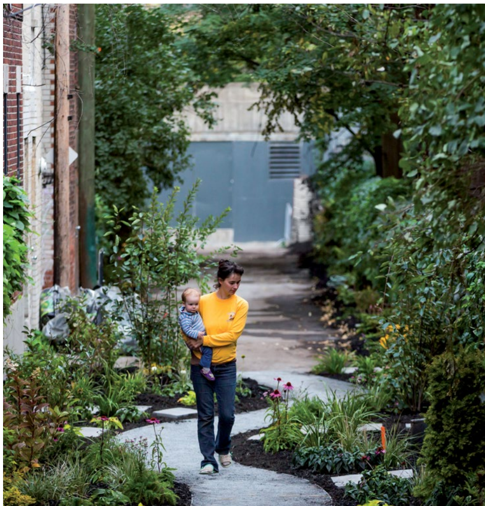
Ruelle Des Pins, Prince-Arthur, Du Parc, Hutchison, Photo : Toma Iczkovits

* Par champêtre, nous entendons une ruelle où un tronçon est entièrement désasphalté. Ce type de ruelle est privilégié par l'arrondissement qui souhaite optimiser les impacts environnementaux et sociaux des projets.