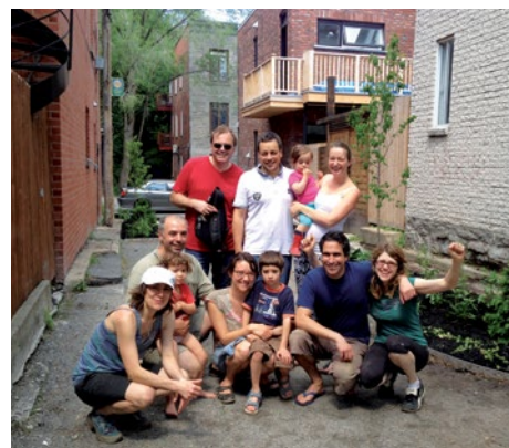
Ruelle Rachel, Gauthier, Bordeaux, Dorion

Si un ou des résident(e)s sont contre le projet, c'est à ce stade-ci qu'ils doivent se prononcer. Ils ont 30 jours après la rencontre d'information pour déposer une pétition démontrant que plus de 50 % des résident(e)s-riverain(e)s s'opposent au projet pour pouvoir le remettre en question.