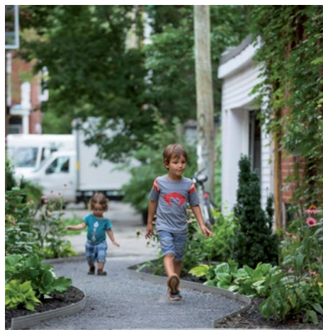
Ruelle Gilford, De Bienville, Saint-Hubert, Resther