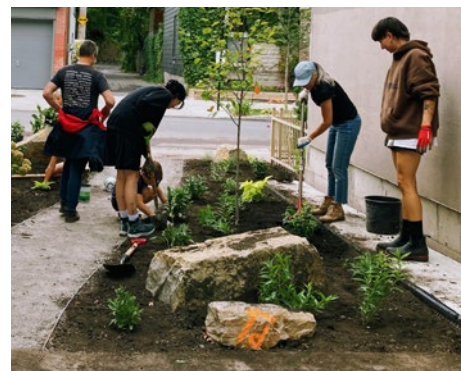
Ruelle Mont-Royal, Marie-Anne, Christophe-Colomb, Boyer