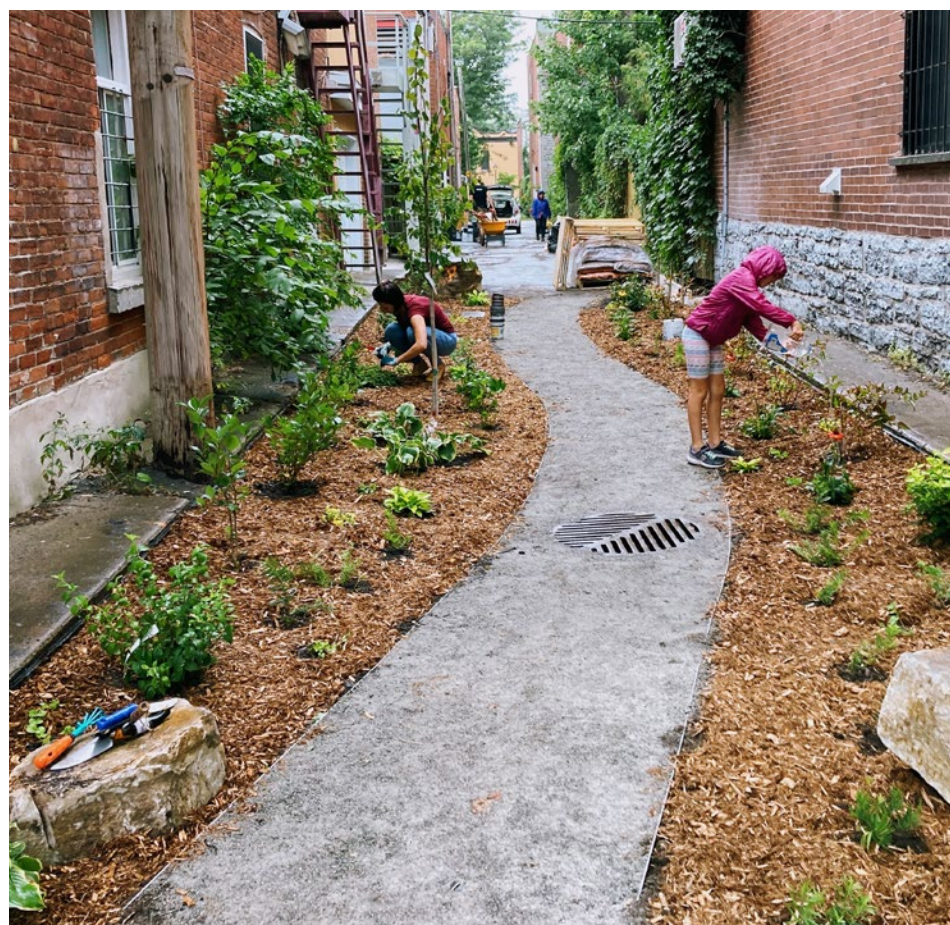
Ruelle Gilford, de Bienville, Saint-André, Saint-Hubert

L'arrondissement fournit les végétaux la première année de réalisation. Les résident(e)s sont responsables de remplacer les végétaux qui meurent par manque d'entretien.