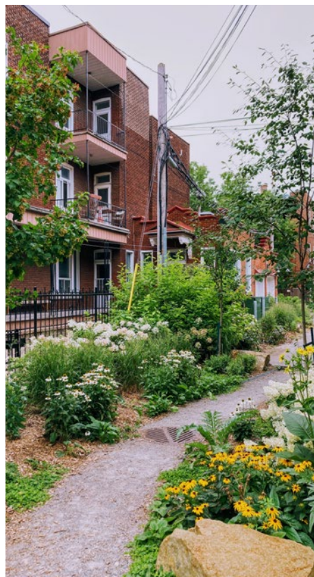
Ruelle Laurier, Saint-Joseph, Garnier, de Lanaudière

Arrondissement du Plateau-Mont-Royal 201, avenue Laurier Est, 5 e étage Montréal (Québec) H2T 3E6