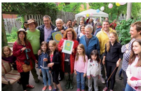
Ruelle Gaston-Michaud, Roy, Duluth, Drolet, Henri-Julien