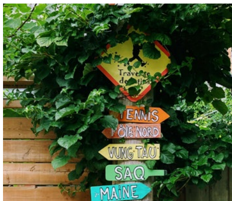
Ruelle Gilford, Mont-Royal, Chabot, Cartier