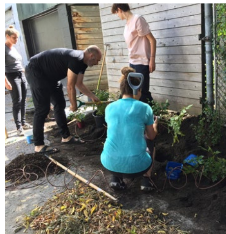
Ruelle Mont-Royal, Marie-Anne, Christophe-Colomb, Boyer