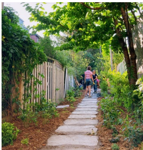
Ruelle Saint-Cuthbert, Roy, Sewell, Saint-Urbain