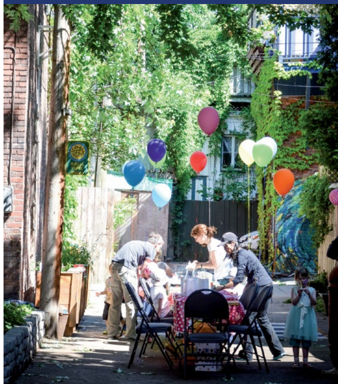
Ruelle Prince-Arthur, Sherbrooke, Laval, Hôtel-de-Ville

L'entretien de la ruelle verte ! Pour y arriver, prévoyez périodiquement des activités qui mobiliseront les riverains. Vous avez besoin d'une bonne équipe pour vous assurer de la pérennité des efforts de verdissement réalisés.