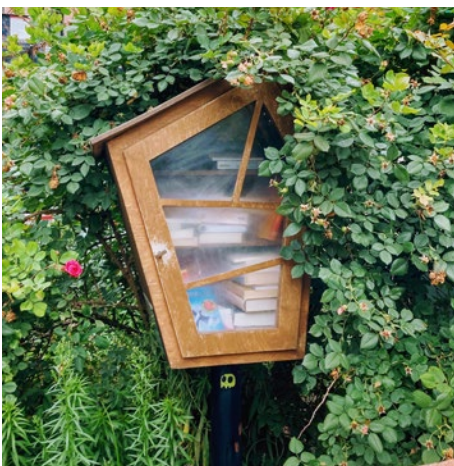
Ruelle Saint-Grégoire, Laurier, Papineau, Marquette

Annexe 3 : Exemple d'échéancier des ruelles vertes ..... 15