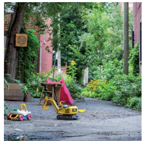
Ruelle Gauthier, Sherbrooke, Dorion, Cartier