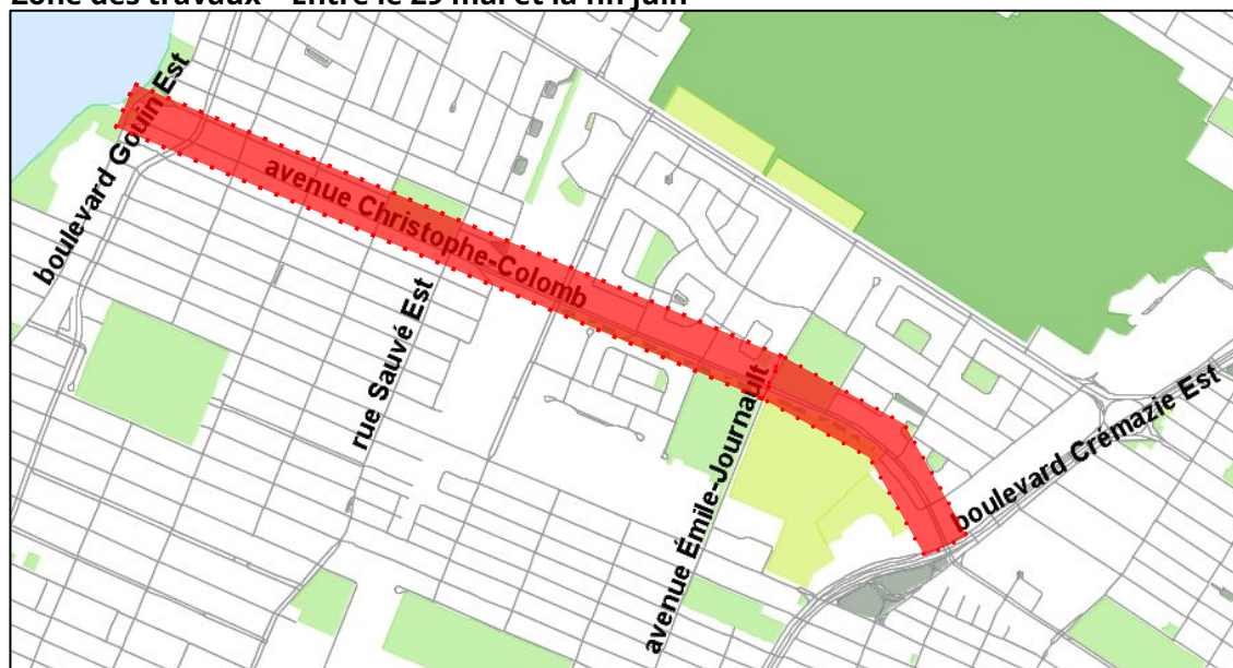
Zone des travaux - Entre le 29 mai et la fin juin