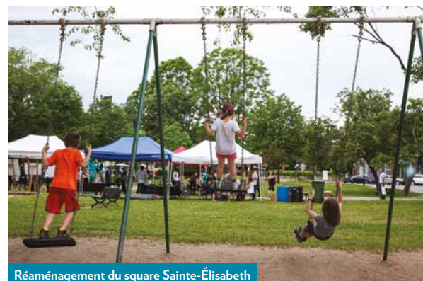
Réaménagement du square Sainte-Élisabeth