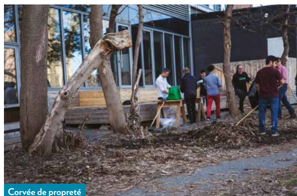
Corvée de propreté

Le PTI planifie sur trois ans des investissements financés au moyen d'emprunts et de subventions. Certains travaux sont aussi payés au comptant grâce aux surplus que nous accumulons, surtout lorsque la vigueur immobilière génère d'importants revenus de permis de toutes sortes. Ces réserves contribuent à parer aux imprévus, à maintenir ou améliorer notre prestation de services, à équilibrer les futurs budgets et à assurer la poursuite de plusieurs projets. Le Programme triennal d'immobilisations (PTI) sert notamment à la réfection de rues et des bâtiments, à l'apaisement de la circulation et à l'aménagement des parcs.